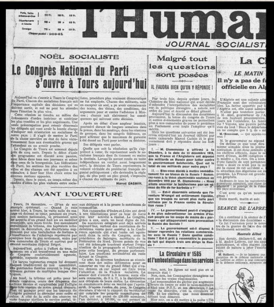
● Journal socialiste 'L'Humanité' annonçant l'ouverture du Congrès, 25 décembre 1920.