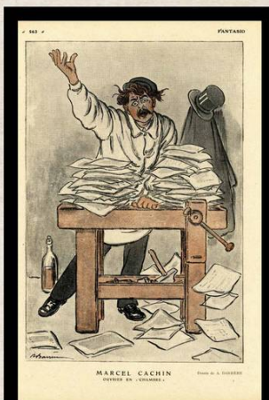
● Caricature de Marcel Cachin en ouvrier d'imprimerie paru dans le journal « Fantasio », 1919.

Ils militent en faveur de cette entrée et diffusent les 21 conditions imposées pour l'adhésion du parti socialiste dans la III e Internationale. Cette perspective suscite de vifs débats au sein des sections qui désignent leurs délégués pour siéger au 18 e congrès de la SFIO, qui se tient à Tours du 25 au 30 décembre 1920. 285 délégués porteurs de 4 785 mandats débattent autour de 4 tendances d'inégale importance.