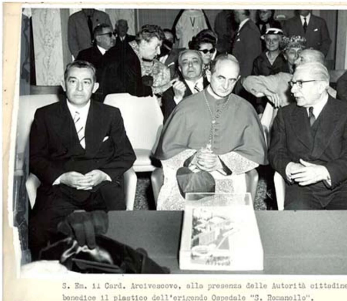
S. Em. il Card. Arcivescovo, alla presenza delle Autorità cittadine benedice il plastico dell'erigendo Ospedale "S. Romanello".

Milanese, nato nel 1885; ha trascorso la prima parte della sua vita a Roma ed è tornato a Milano in forma stabile solo nel 1932, chiamato alla cattedra di topografia del politecnico. Nel 1945 aveva aderito allo PSIUP E poi al PSDI, per le cui liste nel 1952 era stato eletto consigliere comunale di Milano e quindi assessore per le aziende municipalizzate. Scienziato di fama internazionale, fu Presidente dell' Accademia dei Lincei dal 1961 al 1964, anno della sua morte, Presidente della Commissione Geodetica Italiana , vicepresidente dell'Associazione Geodetica Internazionale, Presidente della Società Internazionale di Fotogrammetria oltre che rettore del Politecnico.