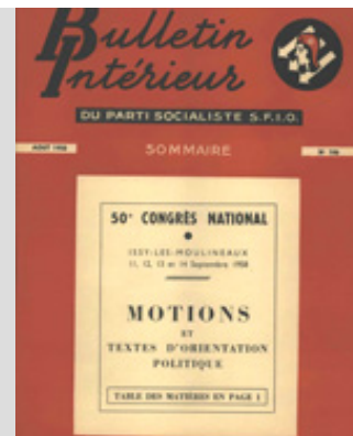
Numéro 106 du Bulletin intérieur de la SFIO (août 1958)