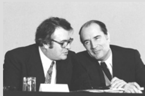
Pierre Mauroy et François Mitterrand aux Assises du socialisme (octobre 1974)