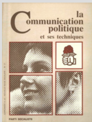
Brochure de formation (Secrétariat national à la communication du PS - 1978)