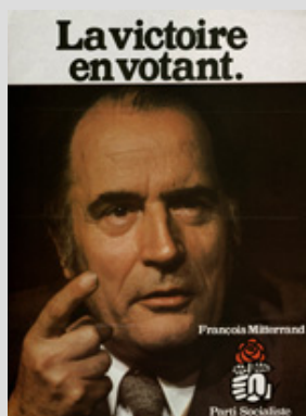
Affiche de campagne pour les élections législatives de 1978